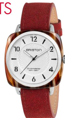
Modèle HMS – L'ELEMENT FEU

Passant amovible en suède - BRISTON gravé sur la boucle ardillon en acier