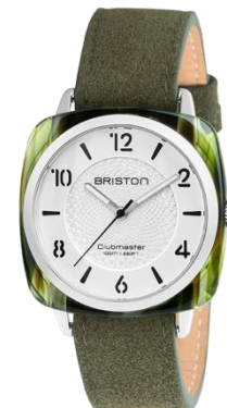
Modèle HMS – L'ELEMENT TERRE