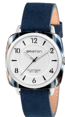
Modèle HMS – L'ELEMENT EAU