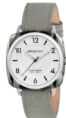
Modèle HMS – L'ELEMENT AIR